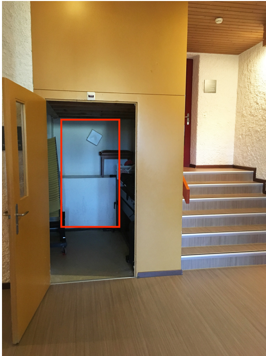
Vorraum Saal mit Lage der neuen Lifttüre