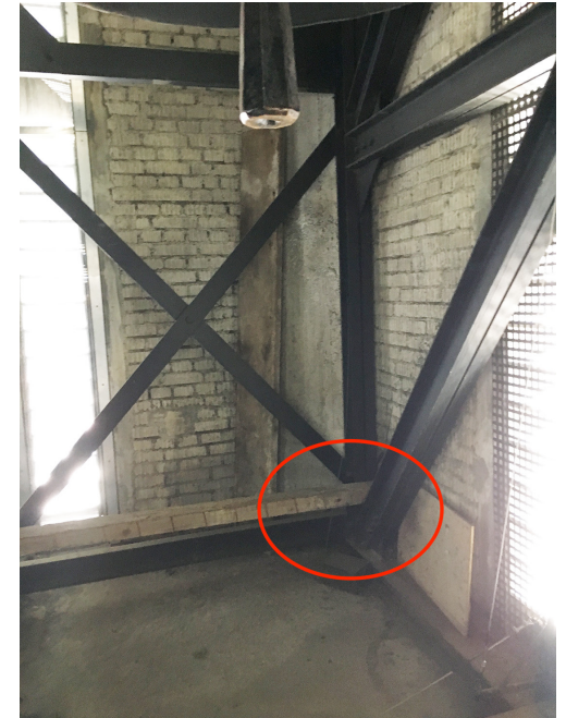
Blick ins Innere des Kirchturms, Glocken und Aufhängekonstruktion