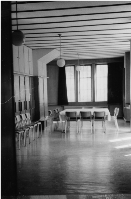
Ehemalige Sakristei der Unterkirche (heutiger Clubraum) als Kindergarten umfunktioniert, ca. 1975