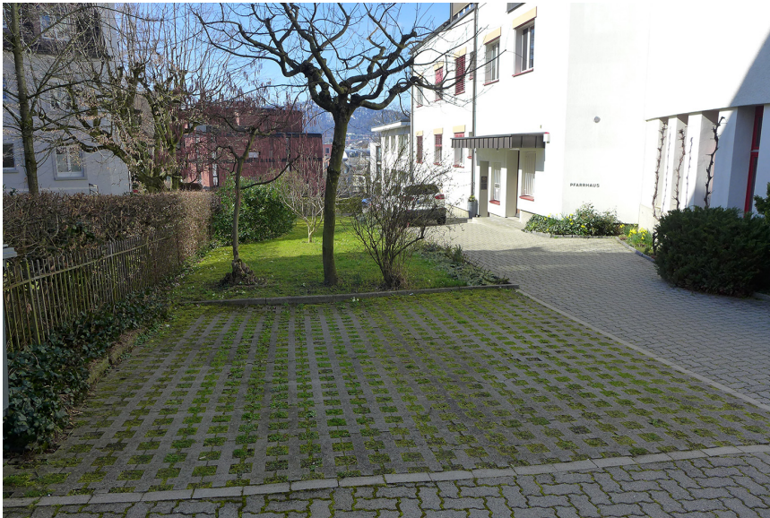
Zugangsbereich zu Pfarrhaus