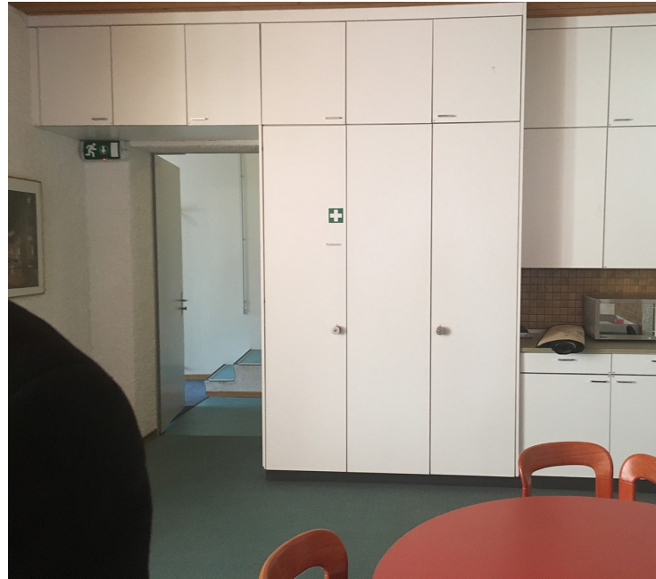
Clubraum 2020 mit Blick auf Zugang vom Pfarrhaus her