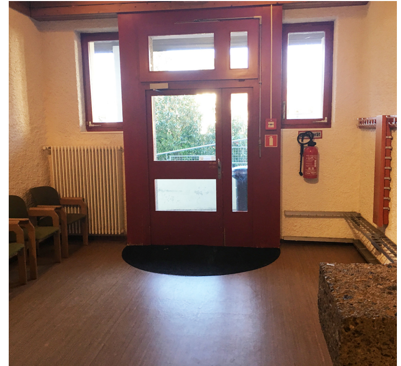
Vorraum Saal mit Blick zu Ausgang in den Garten