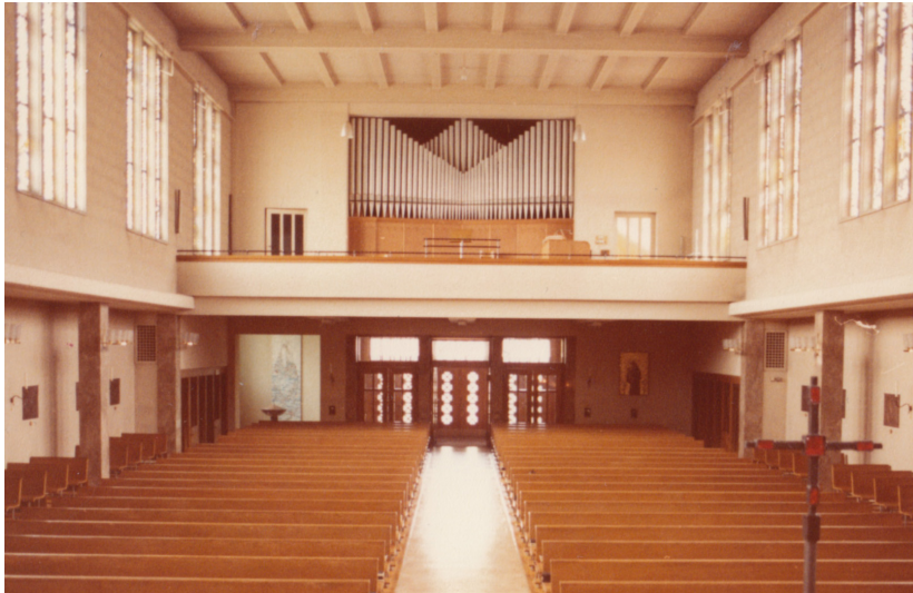
Kirchenraum mit Blick auf Orgel um ca. 1980