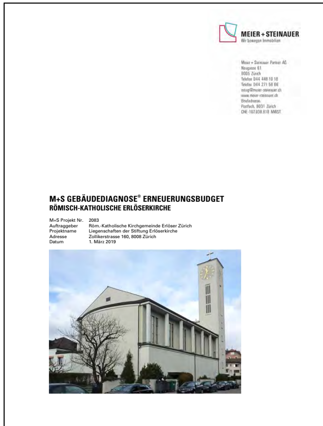
Zustandsaufnahme der Firma Meier + Steinauer

Zustandsaufnahme und energetische Gebäudeaufnahme von Kirche, Pfarrhaus, Jugendhaus und Liegenschaft an der Altenhofstr. 46