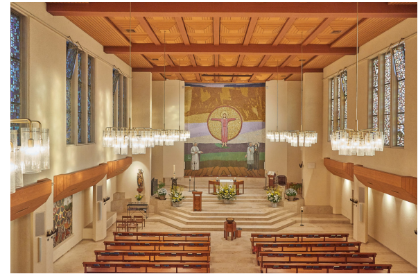
Kirchenraum ab 1981 bis heute