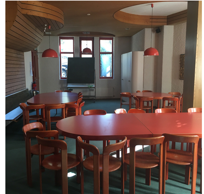
Clubraum 2020 mit Blick zur Zollikerstrasse