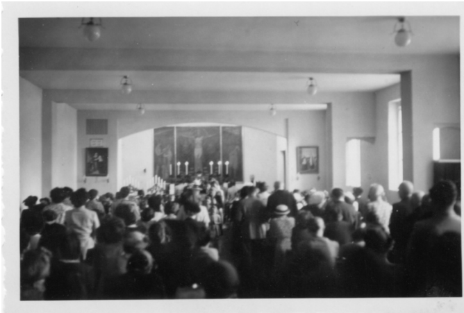
ehemalige Werktagkapelle während eines Gottesdienstes, um 1937