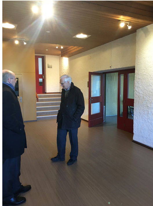
Vorraum Saal mit Blick zu Saaleingangstüre