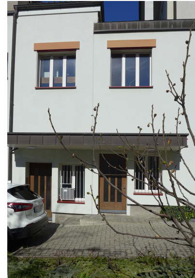
Eingangstüren beim Pfarrhaus