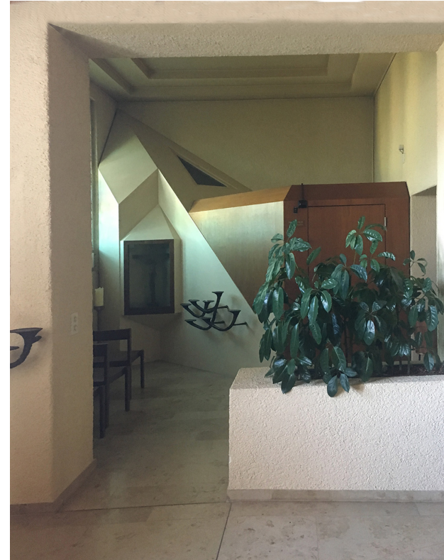
Beichtstuhl mit Andachtsbereich 2020 (ehemalige Taufkapelle)