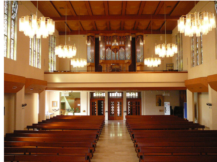
Kirchenraum mit Blick auf Orgel 2020