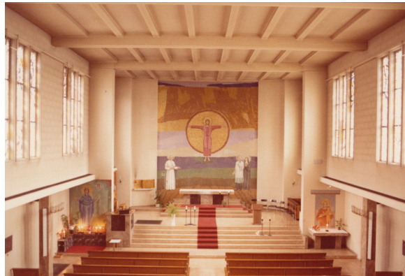
Kirchenraum um 1980, kurz vor Umbau