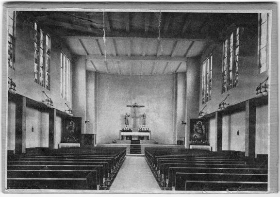
Kirchenraum mit Blick auf den Hochaltar um 1937, kurz nach Fertigstellung