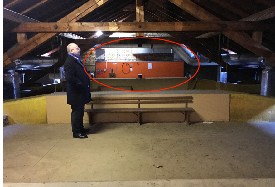
Bestehende Lüftungszentrale im Dachraum der Kirche