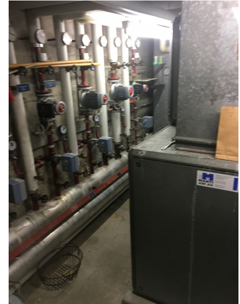
Blick in die Heizzentrale im Untergeschoss der Kirche