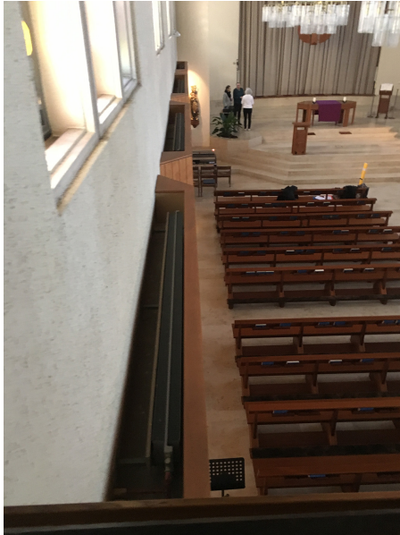
Blick von Empore in den Kirchenraum, mit Blick zu den Heizkörpern unter den Fenstern