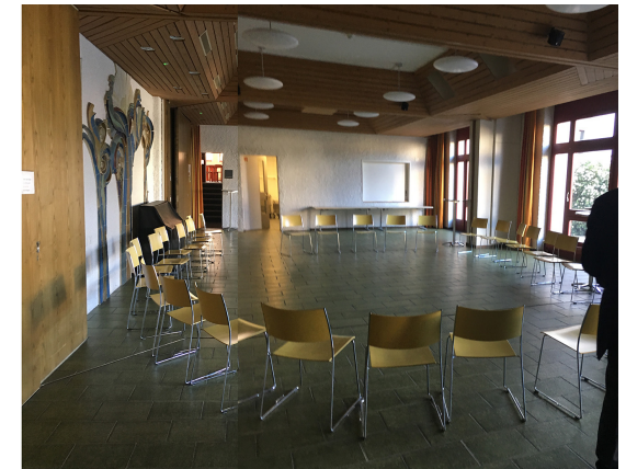
Saal unter der Kirche 2020