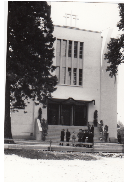
Baustellenfotos aus dem Archiv der Pfarrei Erlöser: 1937 Errichtung der Kirche