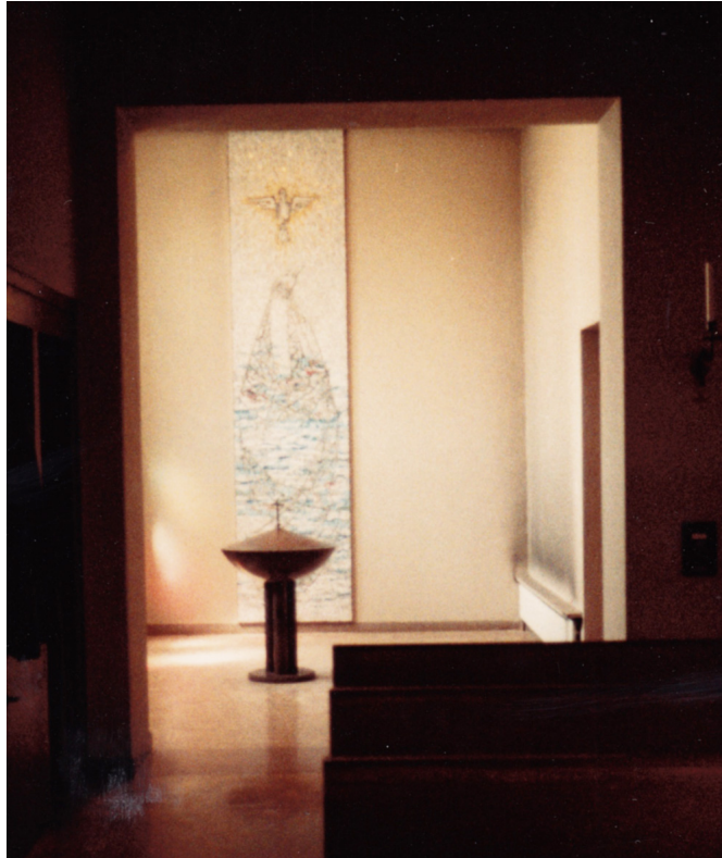
Taufkapelle um 1981