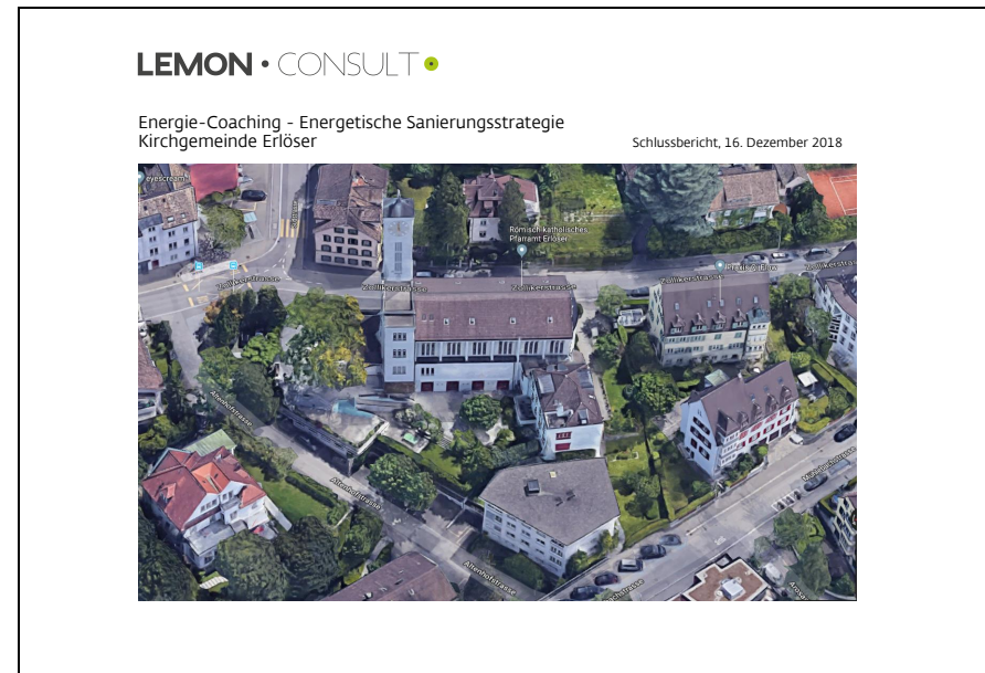
Energetische Gebäudeaufnahme der Firma Lemon Consult